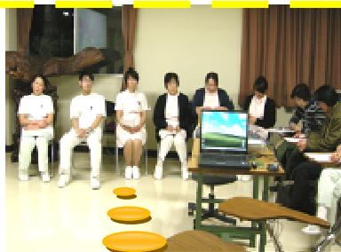
今年度の発表者です