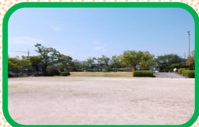
近くに大きな公園があります。