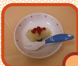
お菓子は子供達と一緒に 作ります。食育にも繋が っています。