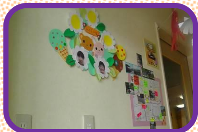
先生の名前と顔をわかり やすく展示しています。