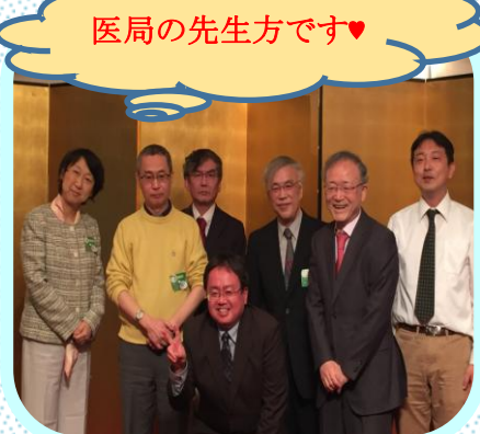
医局の先生方です♥