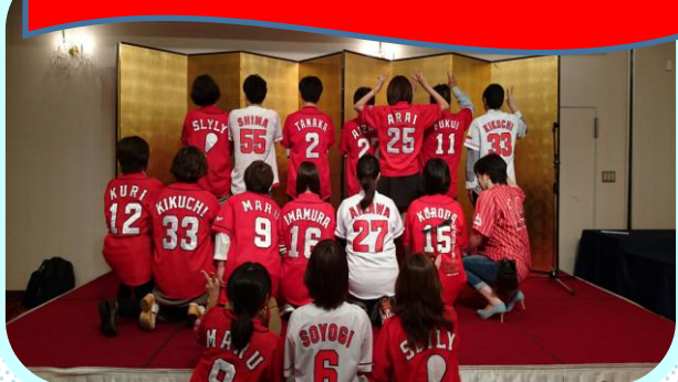
盛り上げてくださったスタッフの方々☆