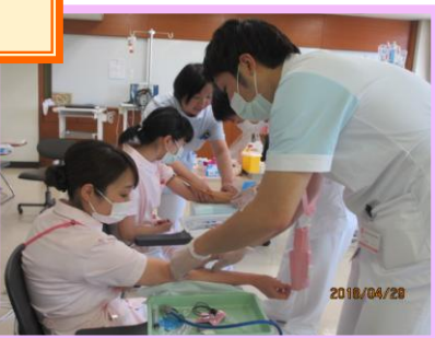
シミュレーター「Qちゃん」を使用しての吸引の実施