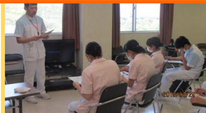
講義を受けていざ実践！

4月末日、6人の新人看護師を対象とした1日実習が行われました。当院では毎年、看護部教育委員会による新人教育として看護技術研修を行っています。今回は新人の皆さんの一生懸命に学んでいる様子を紹介していきます。