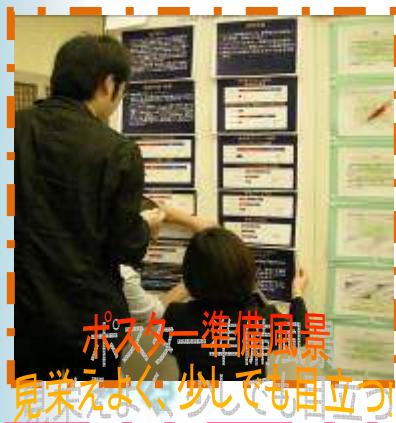
ポスター準備風景 見栄えよく、少しでも自立つ!

発表の時間は短かったですが、多くの方に興味を持っていただき、好評の内に終了しました。これからも様々な取り組みを行っていきます!!