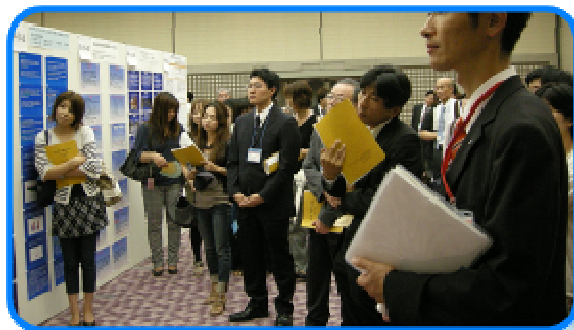
多くの方に見て頂けました!! 😊