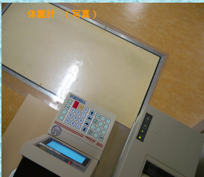
体重測定チケット