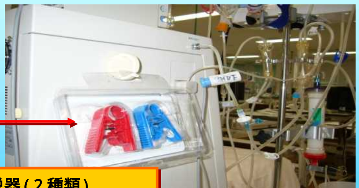
緊急時離脱器(2種類)