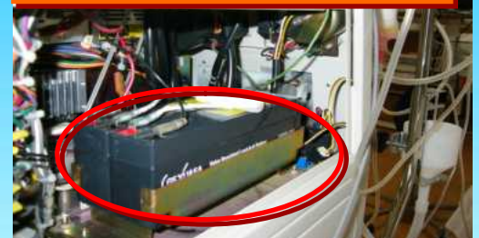
透析用患者監視装置用バッテリー

コンソール専用のバッテリー（停電時対応型）です。バッテリーの稼働時間は約 30 分間です。この間、緊急避難を要するか、比較的時間に余裕があるか、復電までの時間はどれ位なのか、患者様の安全を最優先に様々な状況を正しく判断し迅速に対応します。