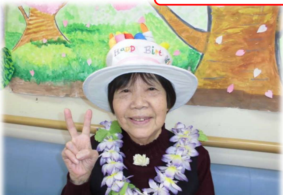
お誕生日おめでとうございます♡