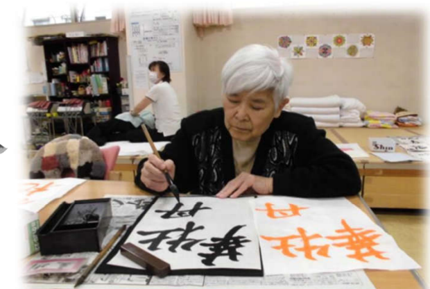
皆さん真剣ですね!