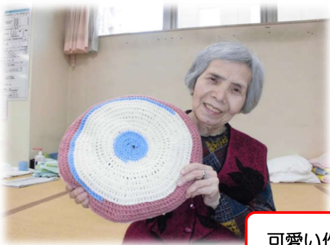
可愛い作品が出来ました♡