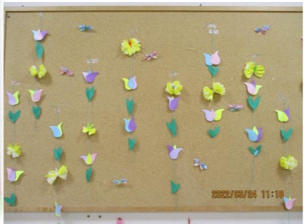
チューリップと チョウチョの可愛 い吊るし飾り… 皆さん、夢中で作 られました。