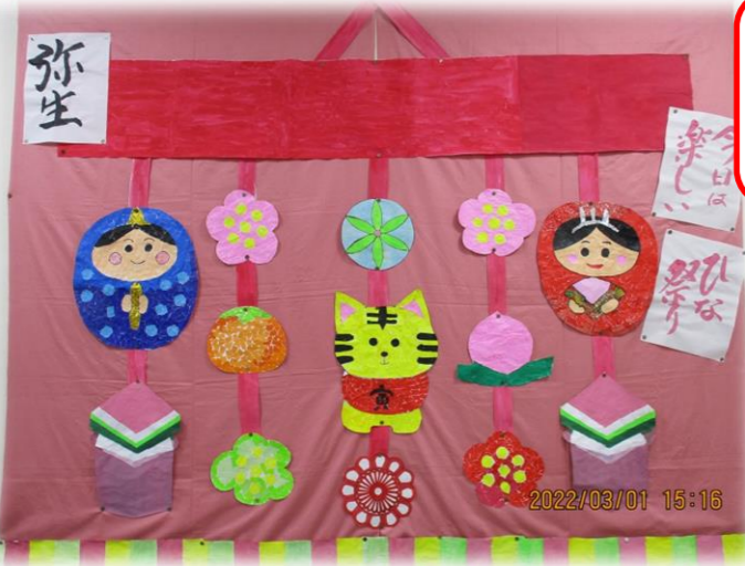
3月の壁飾り 「弥生・お雛様」ですね。 皆さんで、楽しく作りました。