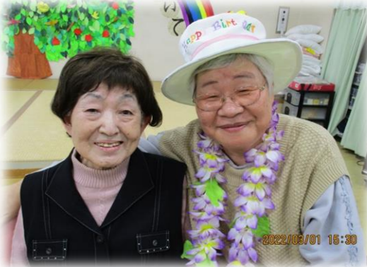
お誕生日おめでとうございます。 素敵な笑顔ですね！